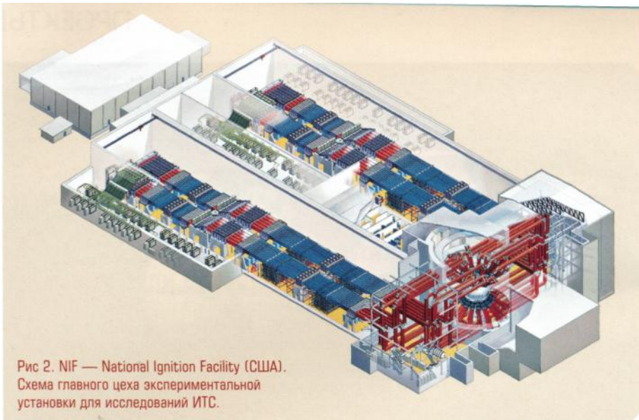
Рис 2. NIF — National Ignition Facility (США). Схема главного цеха экспериментальной установки для исследований ИТС.

Проект «Дедал» достаточно убедительно показал возможность полета автоматических исследовательских зондов к ближайшим звездам. Однако в рамках поставленной проблемы необходимо обосновать возможность пилотируемых полетов на межзвездные расстояния. А переход от полета зонда к межзвездным пилотируемым перелетам значительно сложнее, чем был в свое время переход от спутника к полету Гагарина. Это связано с тем, что помимо разгона до децисветовых скоростей, корабль придется тормозить практически до нулевой скорости. Несмотря на то, что целью проекта был автоматический зонд, в проекте «Дедал» рассматривались и многие аспекты пилотируемых межзвездных кораблей (МК), вплоть до социального устройства жизни экипажа. Г. Матлофф предложил объединить технологии проекта «Дедал» с технологиями космических колоний О'Нейла. Колонии О'Нейла — нашумевший, широко обсуждавшийся, но, к сожалению, подзабытый проект создания искусственных поселений в точках Лагранжа. Согласно Г. Матлоффу, МК со стартовым весом 650 тысяч тонн с экипажем в 2000 человек способен достичь звезд Альфа Центавра и Тау Кита за 400 и 1100 лет соответственно.